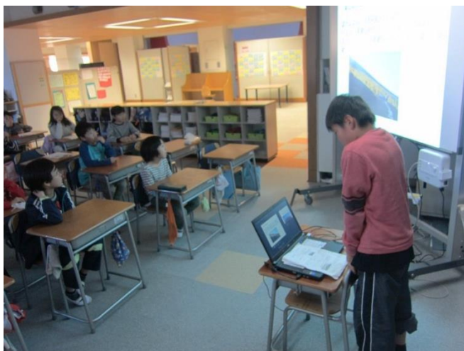
【コンピュータを操作して発表しました】