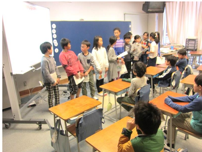
【学級を2グループに分けて発表しました】

3年生も、自分たちが来年参加するプレセカンドスクールのことを知ることができて、楽しみながら発表を聞いていました。